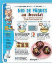
La bonne recette d'Anicet