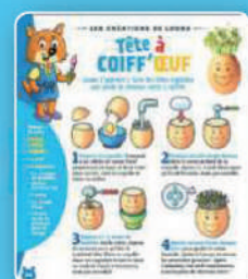
Les créations de Louna