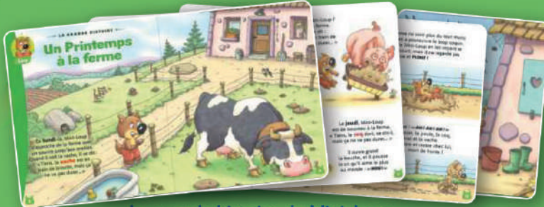
La grande histoire de Mini-Loup