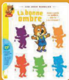
Les jeux rigolos