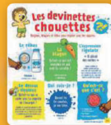
Les devinettes chouettes