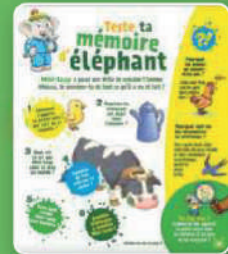
Teste ta mémoire