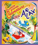
La petite grande chaventure d'Ajax