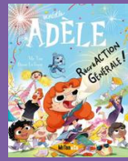
Tome 21 récréACTION générale