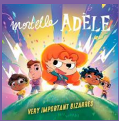
Album musical Very Important Bizarres